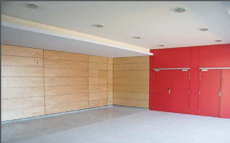
Hall d'entrée - accueil