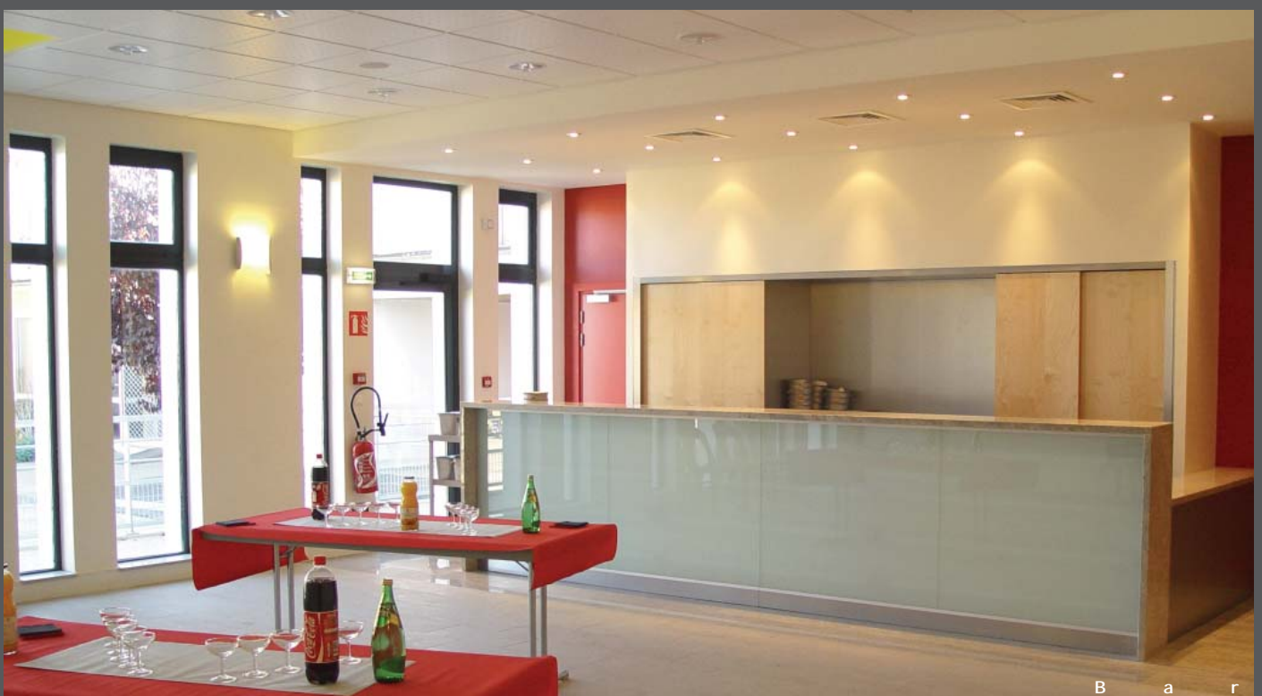
B a r