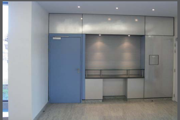
Accueil - vestiaires dans le hall