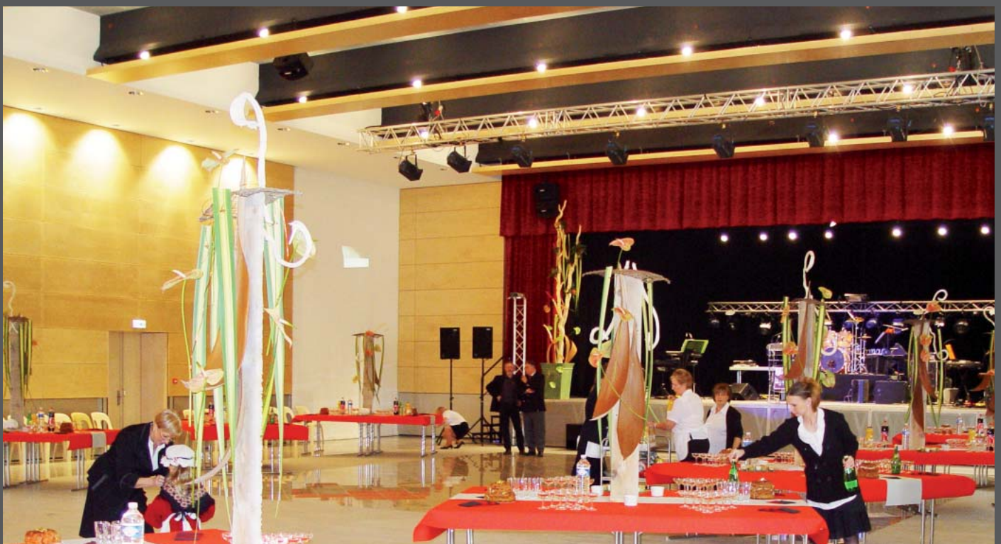
Vue sur panneau acoustique grande salle