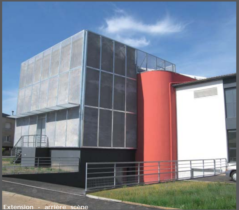
Extension - arrière scène