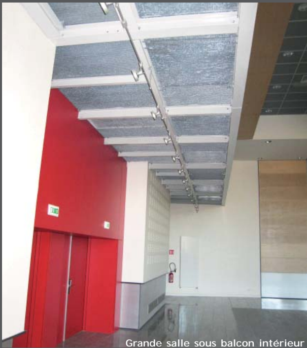
Grande salle sous balcon intérieur