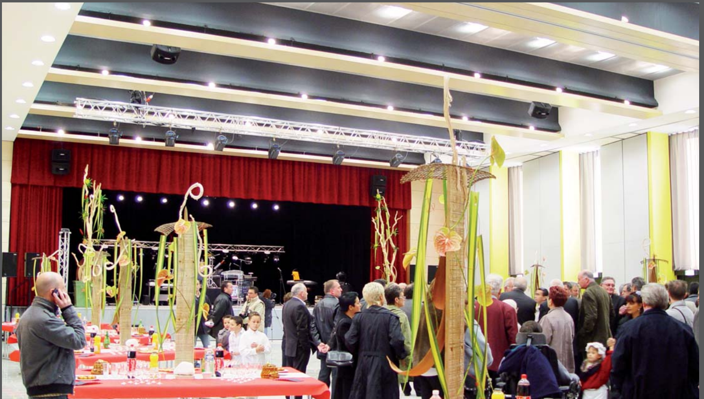
Vue sur scène grande salle