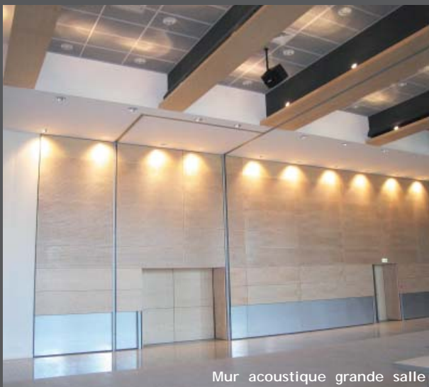
Mur acoustique grande salle