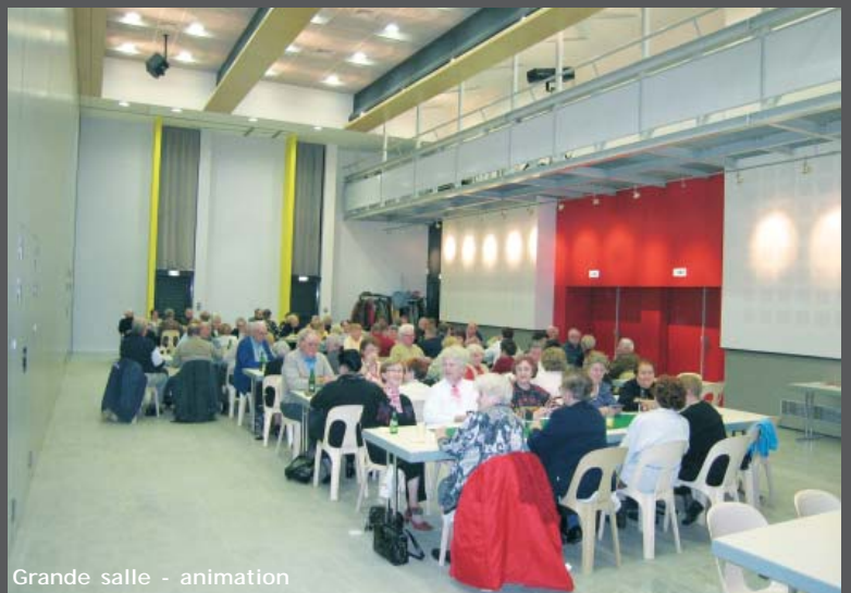
Grande salle - animation