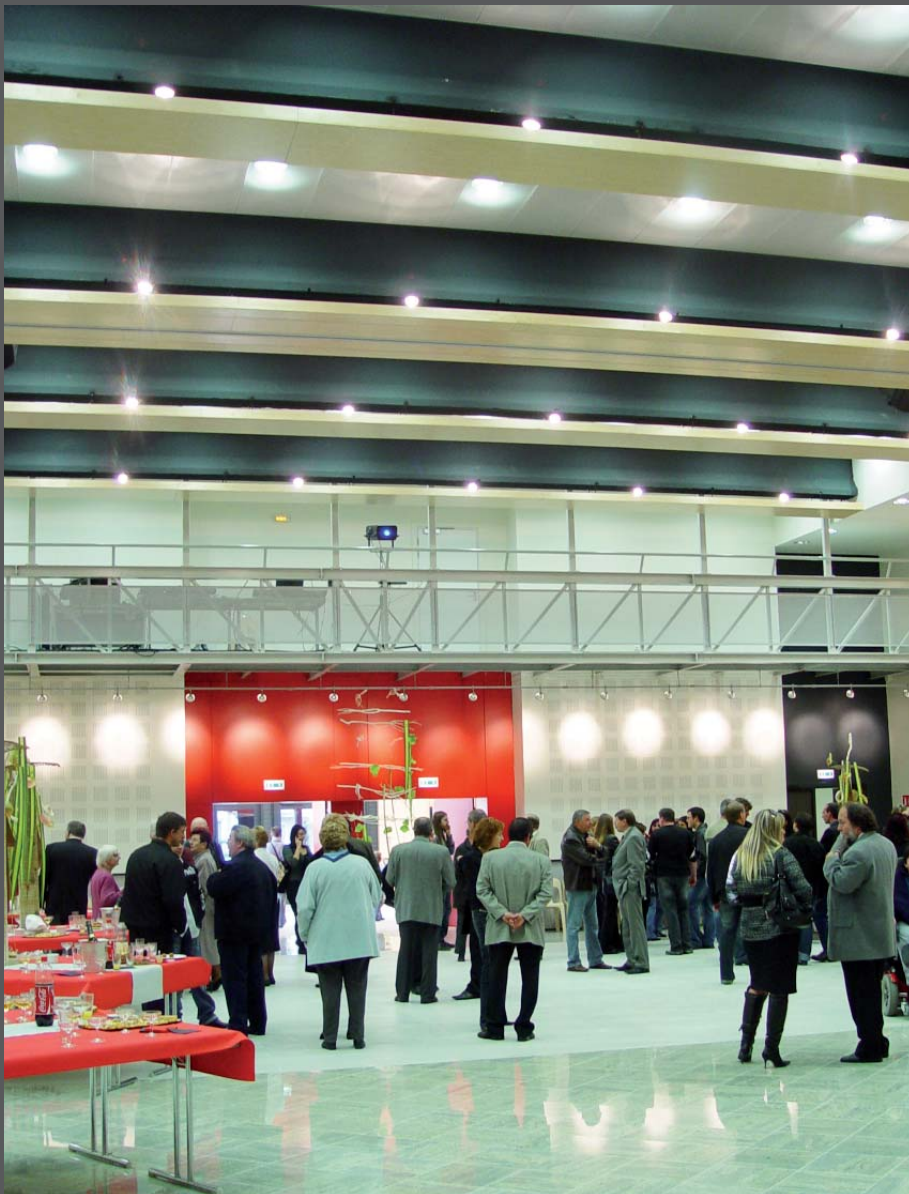
Vue sur entrée grande salle