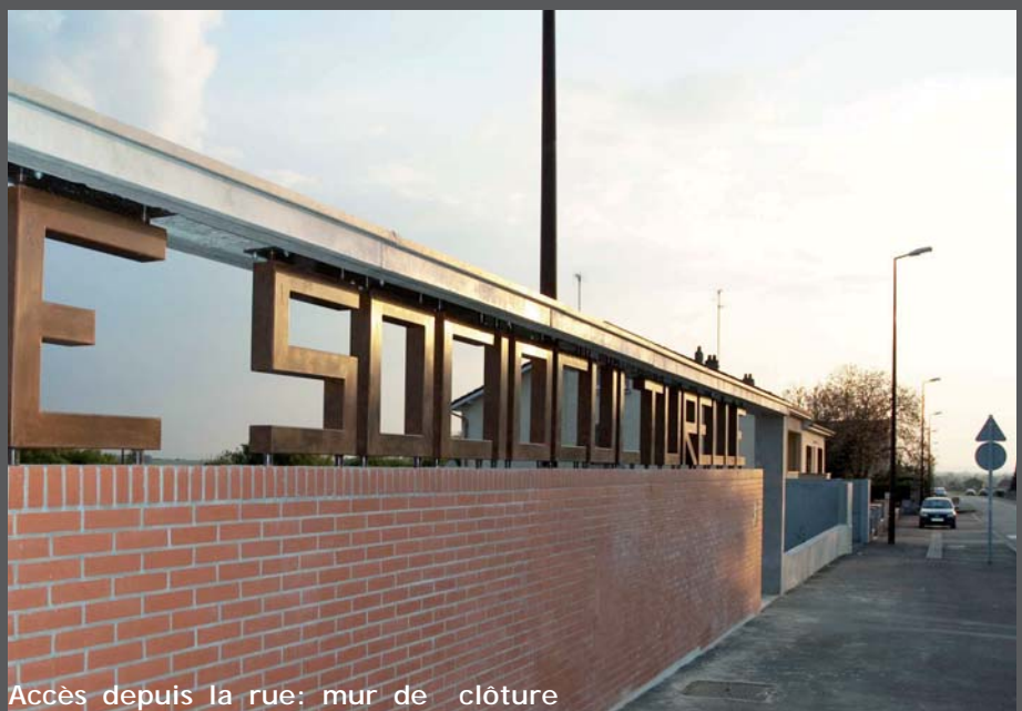
Accès depuis la rue: mur de clôture