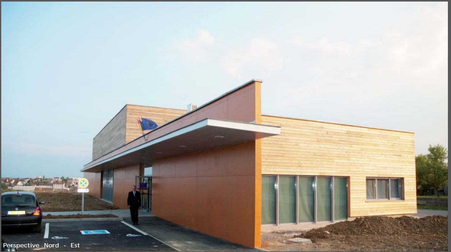
Perspective Nord - Est