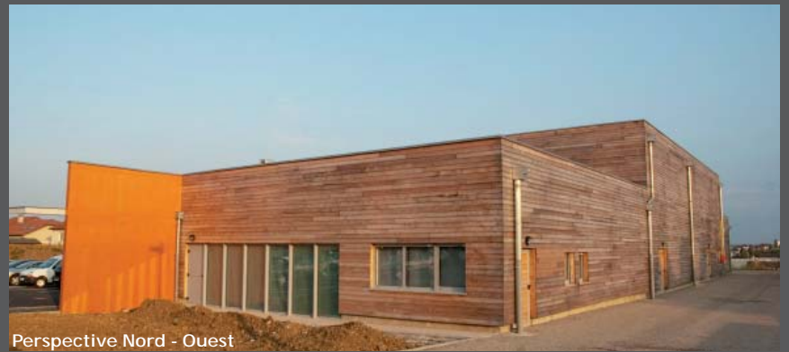
Perspective Nord - Ouest