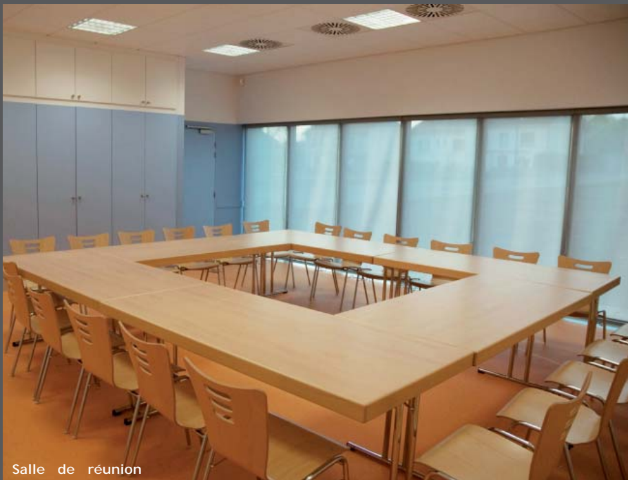
Salle de réunion