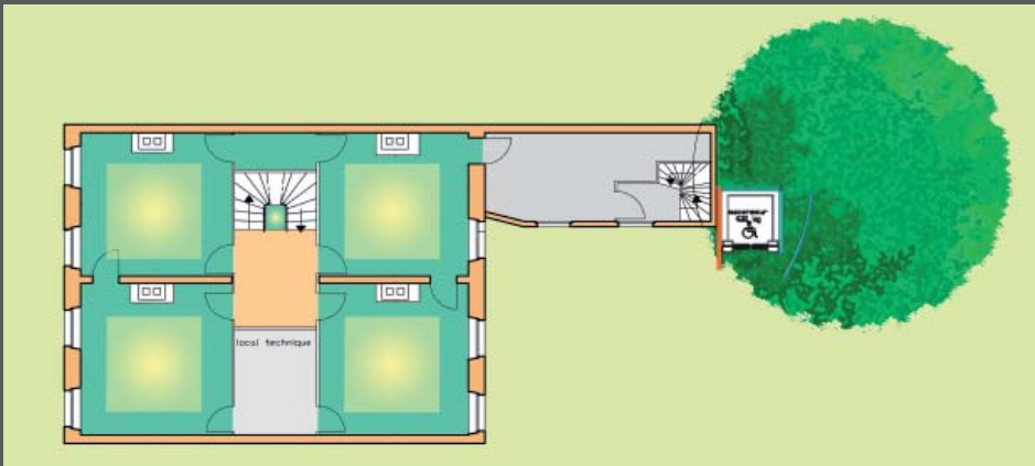
Plan de l'étage courant de la maison Rimbaud réaménagée en musée