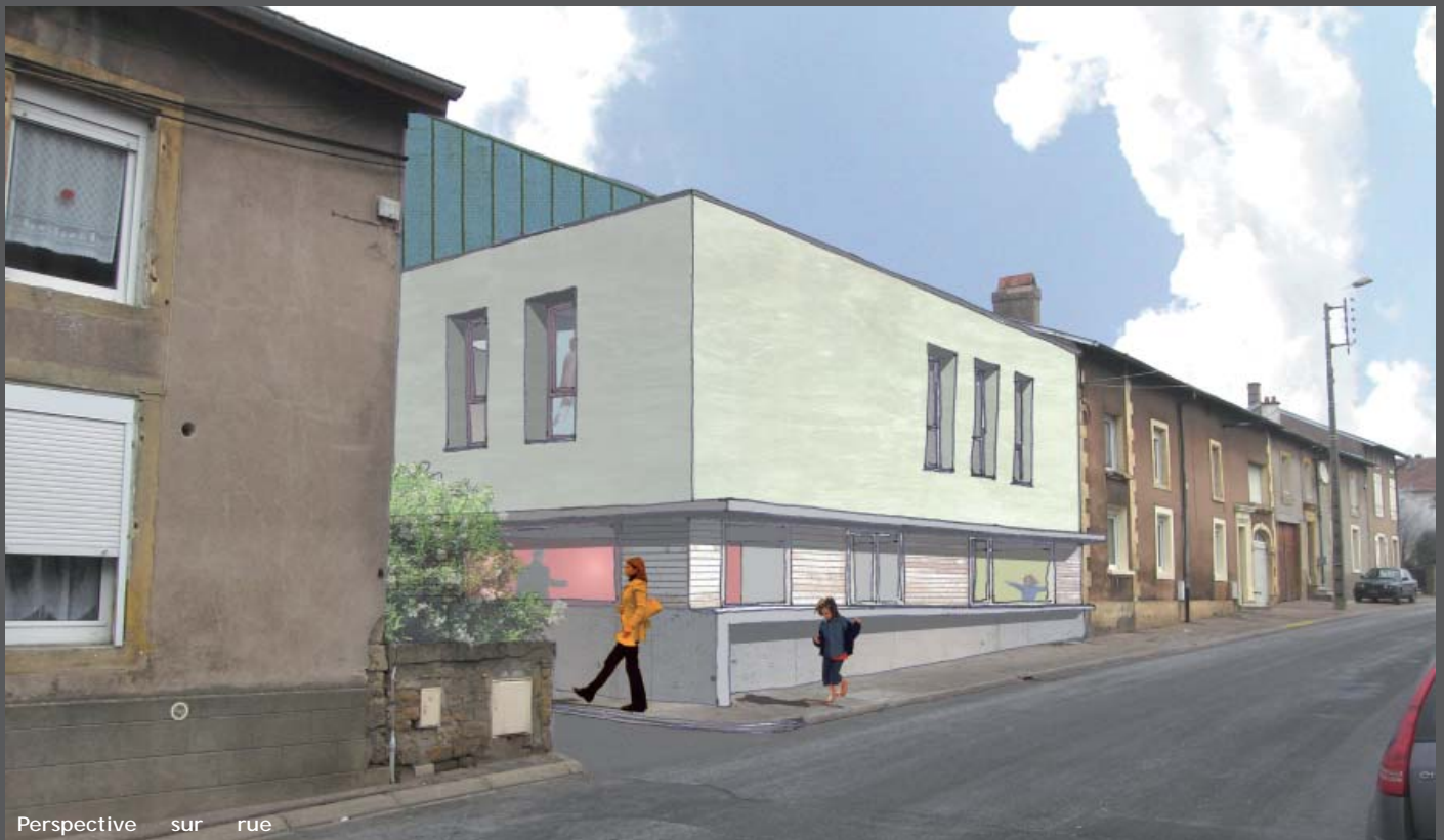
Perspective sur rue