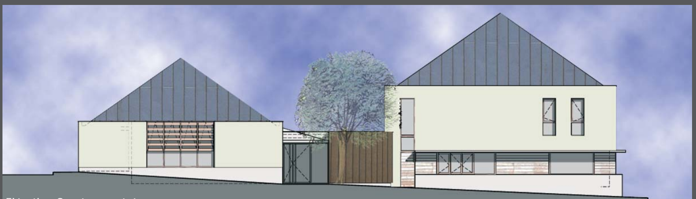
Élévation Ouest sur entrée