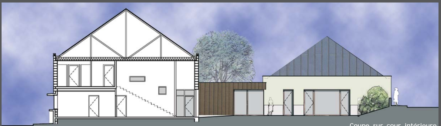
Coupe sur cour intérieure