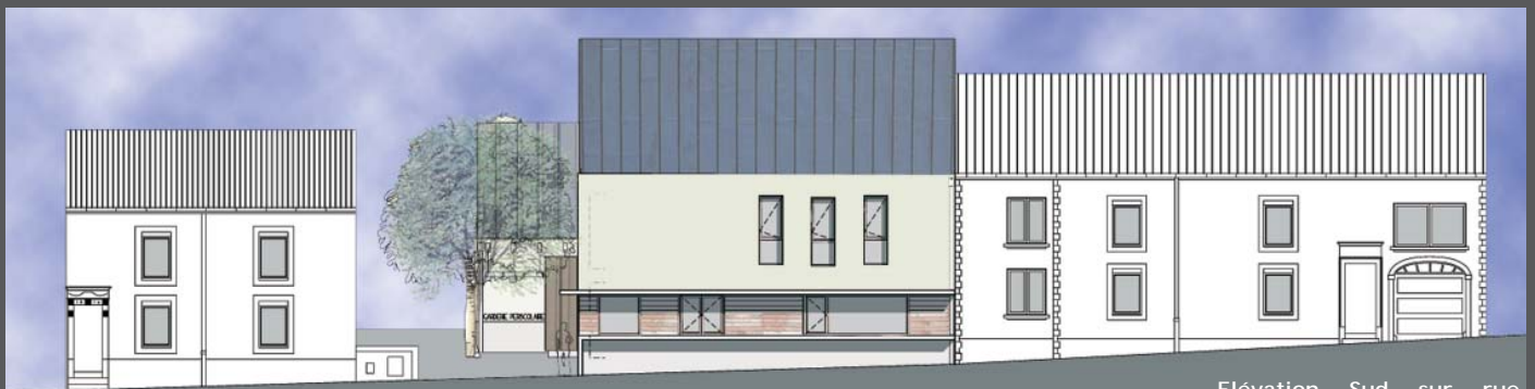
Élévation Sud sur rue