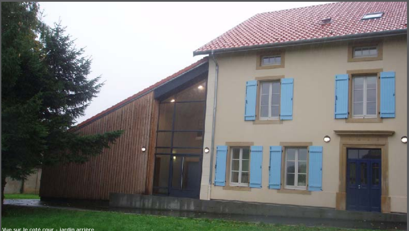
Vue sur le côté cour - jardin arrière