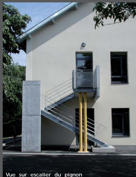
Vue sur escalier du pignon