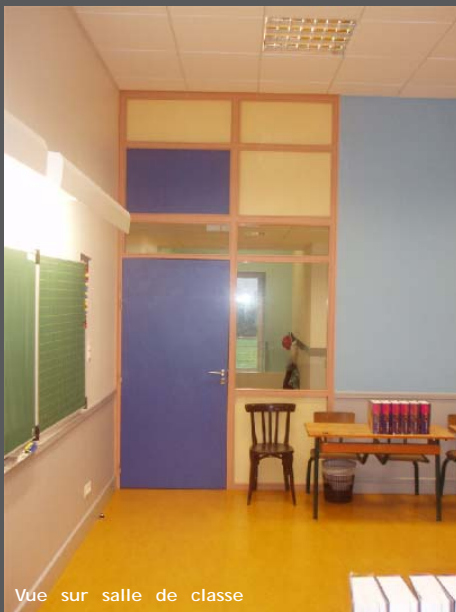
Vue sur salle de classe