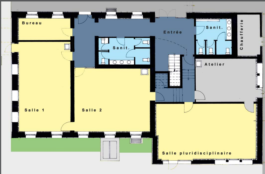
Plan du rez - de - chaussée