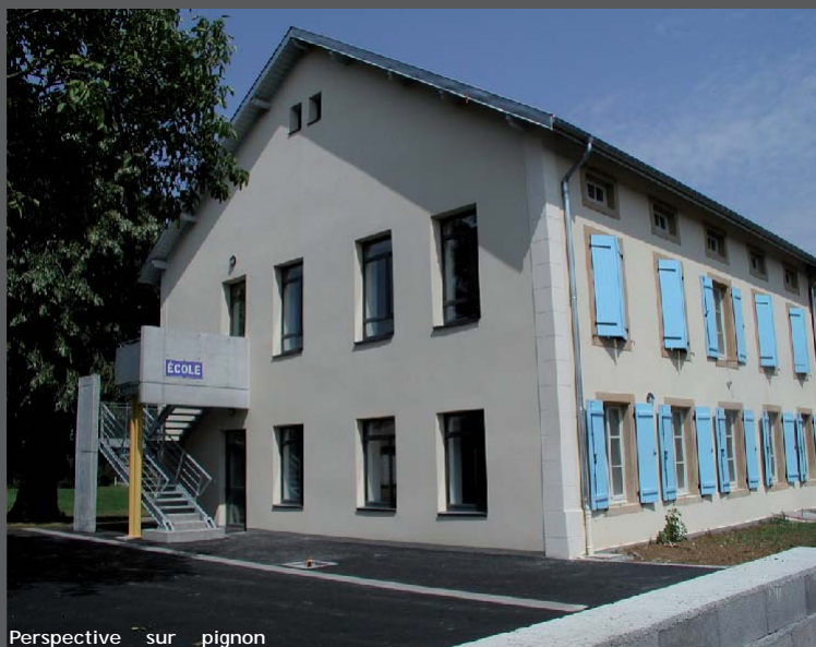
Perspective sur pignon

Calendrier : début de l'étude: septembre 2002 - début des travaux: septembre 2003 - fin des travaux: août 2004