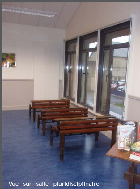
Vue sur salle pluridisciplinaire