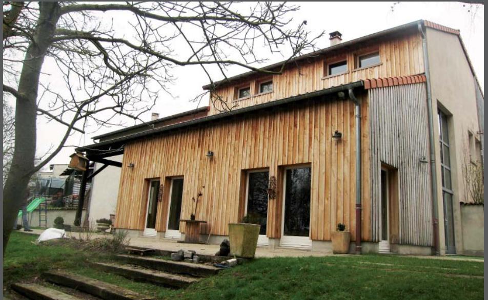
Vue (Sud - Ouest) depuis le jardin