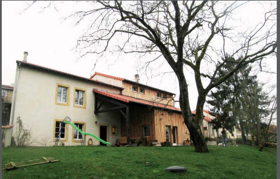
Vue (Nord - Ouest) depuis le jardin