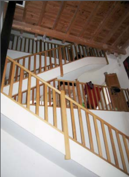
Escalier bois du hall d'entrée