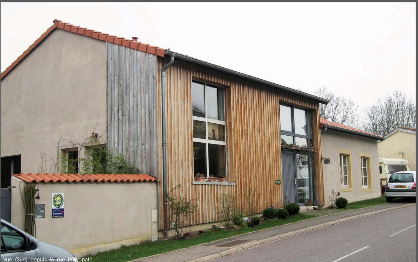
Vue (Sud) depuis la rue Principale