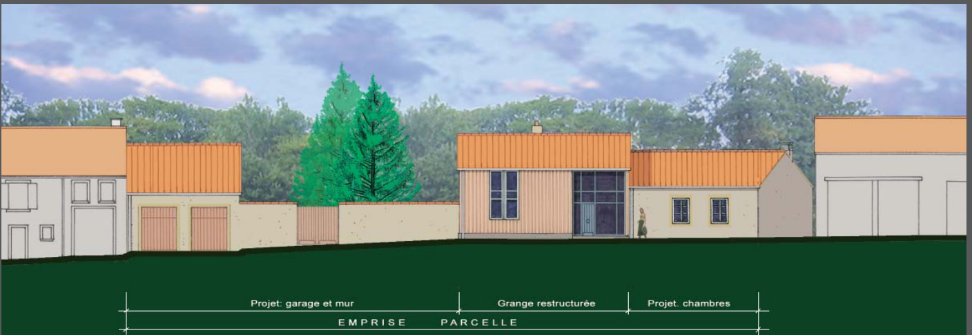
Séquence de façades rue Principale