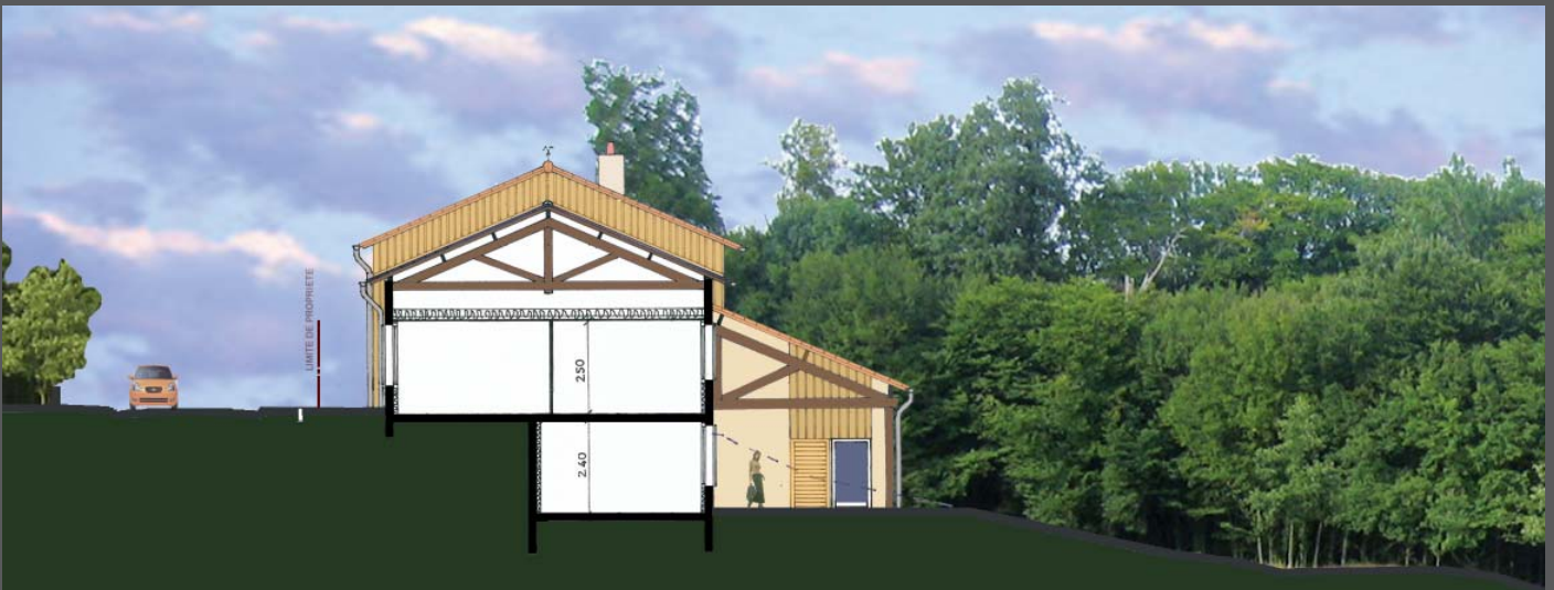
Coupe transversale sur bâtiment et terrain