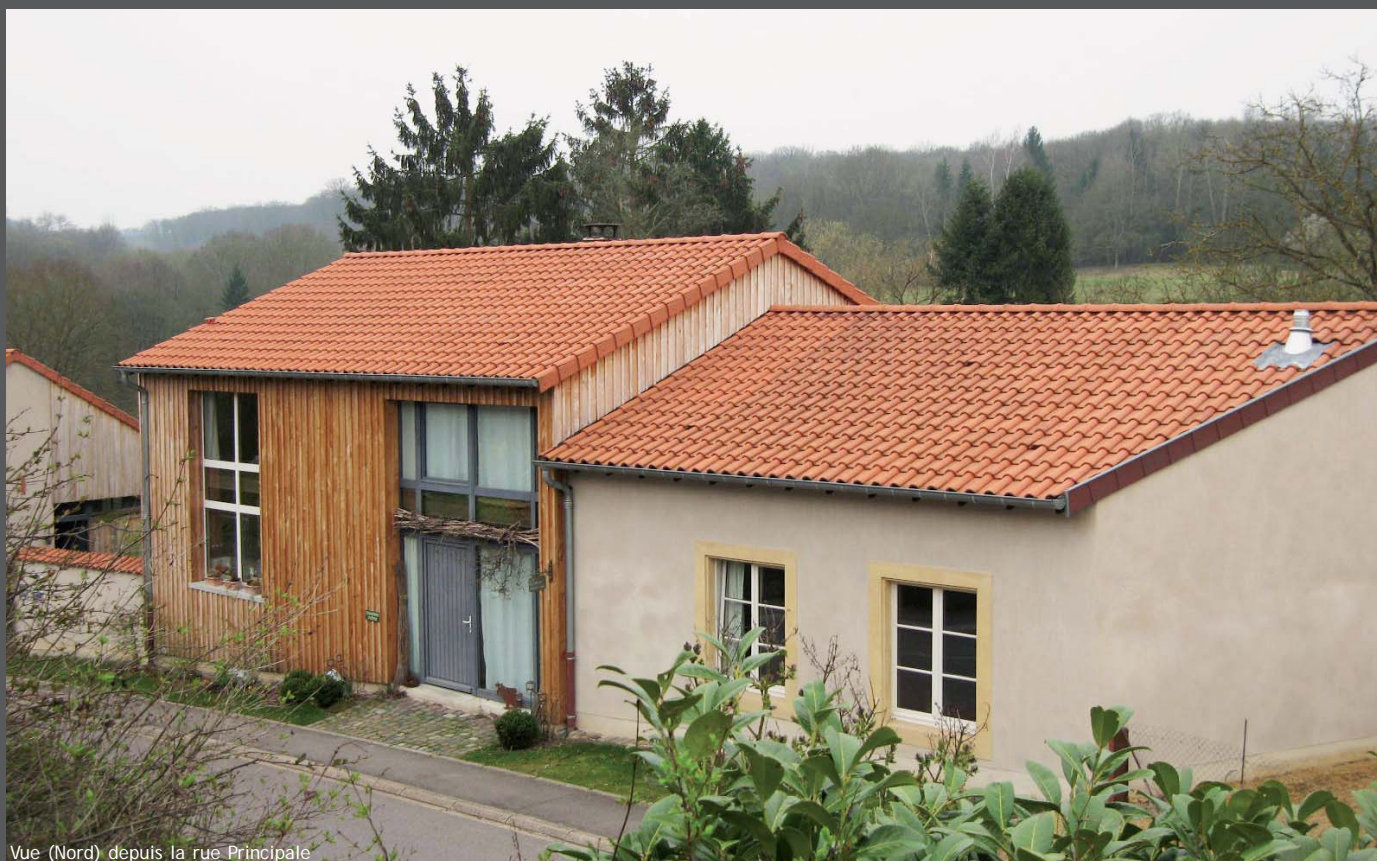
Vue (Nord) depuis la rue Principale