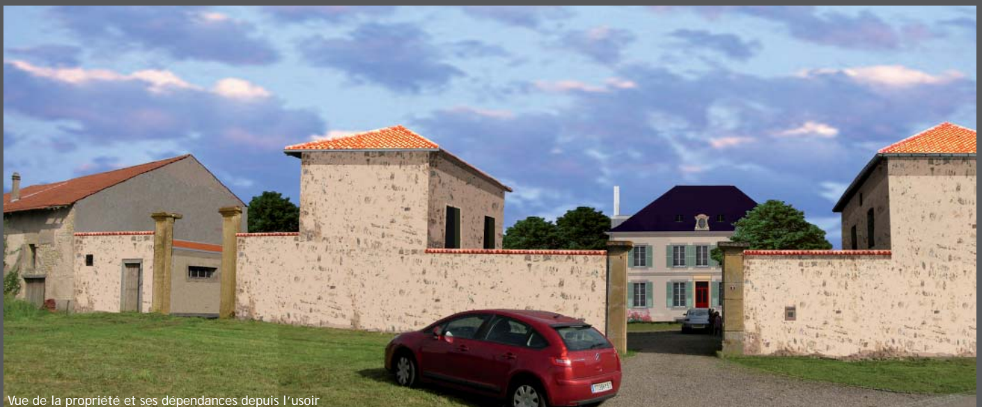
Vue de la propriété et ses dépendances depuis l'usoir