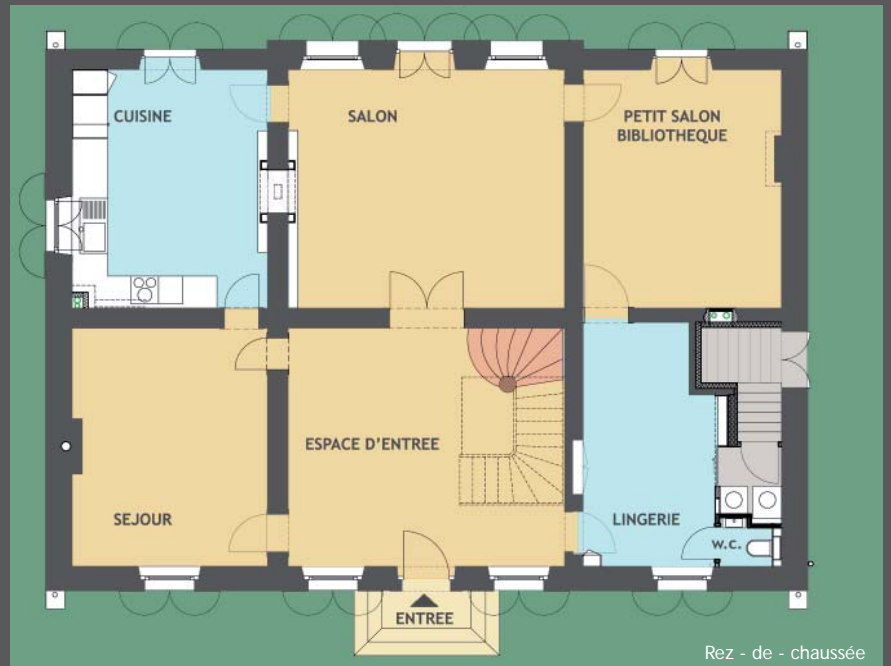
Rez - de - chaussée