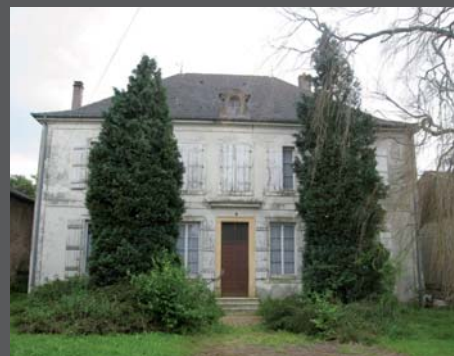
Elévation Nord - entrée