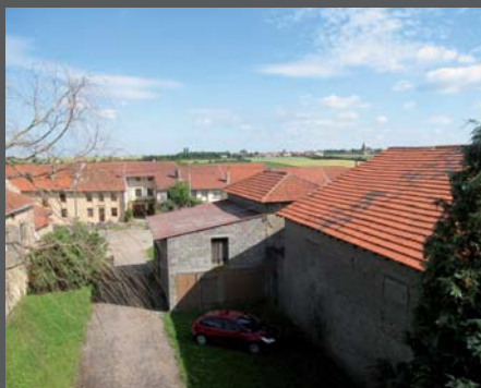
Vue sur dépendances