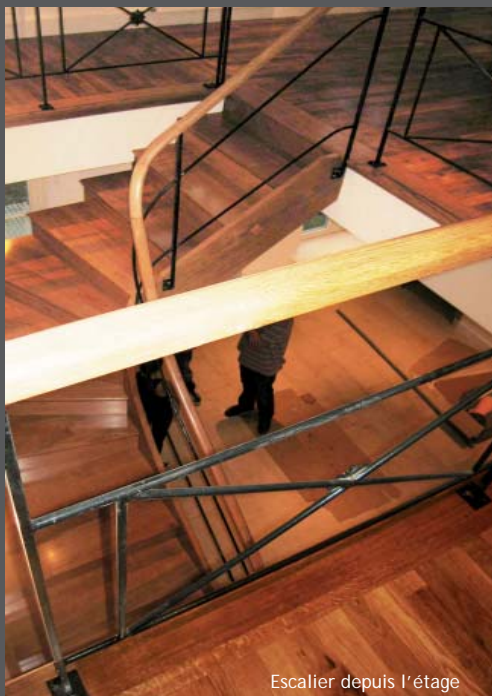
Escalier depuis l'étage