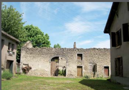
EXISTANT: bâtiment B - élévation Ouest