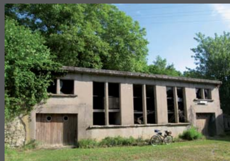
EXISTANT: bâtiment C - élévation Sud