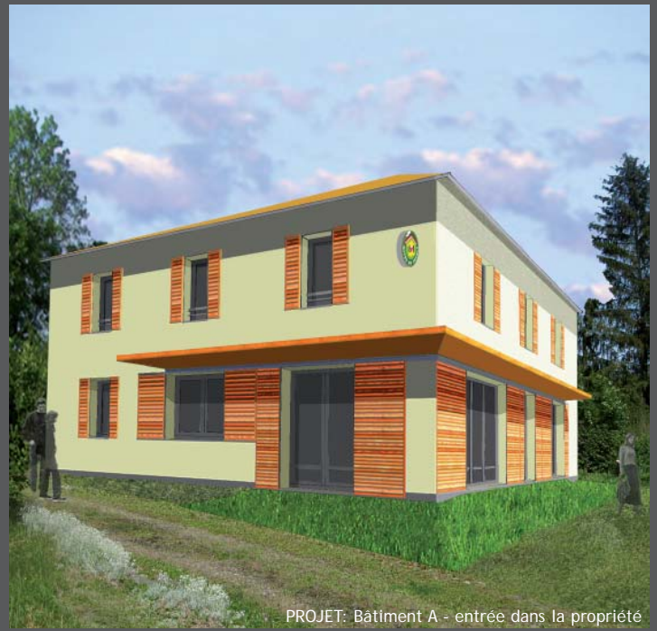
PROJET: Bâtiment A - entrée dans la propriété