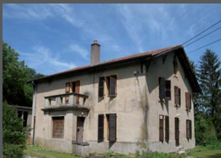
EXISTANT: bâtiment A - perspective Sud - Ouest

Ainsi, cette restructuration, en tenant compte de l'existant, apporte un aspect neuf plus contemporain tout en s'intégrant dans un contexte fortement végétal.