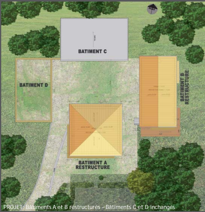
PROJET: Bâtiments A et B restructurés - Bâtiments C et D inchangés