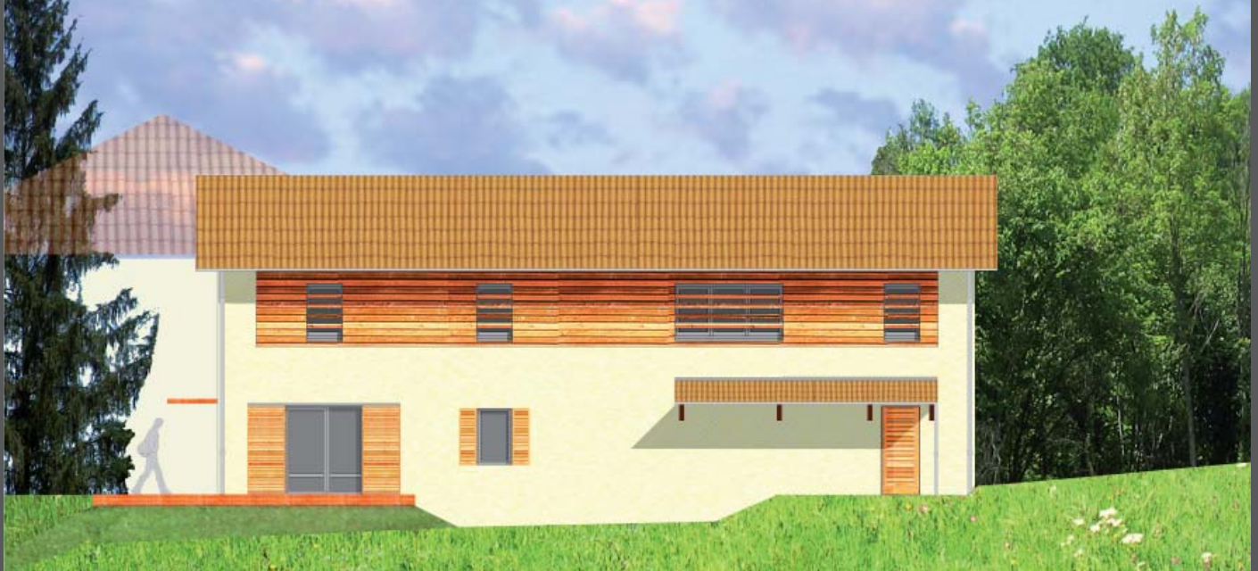
PROJET: Bâtiments A et B - élévation Ouest