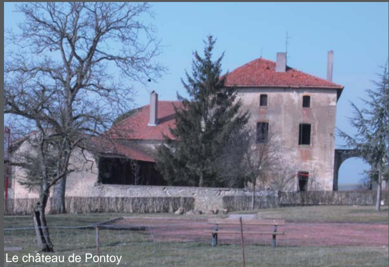
Le château de Pontoy