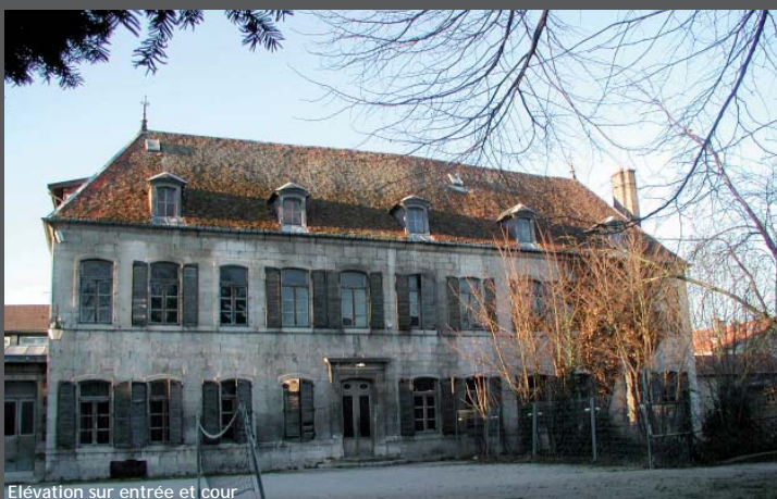
Élévation sur entrée et cour