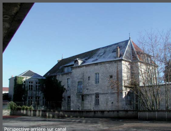
Perspective arrière sur canal